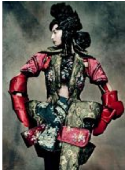
Imagen N°3. Paolo Roversi para Rei Kawakubo