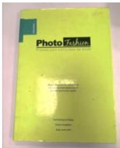
Imagen N°1. Photo Fashion