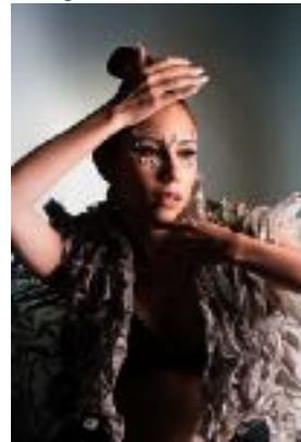
Imagen N°15. Mutante