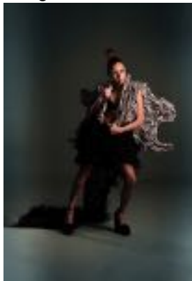
Imagen N°14. Mutante