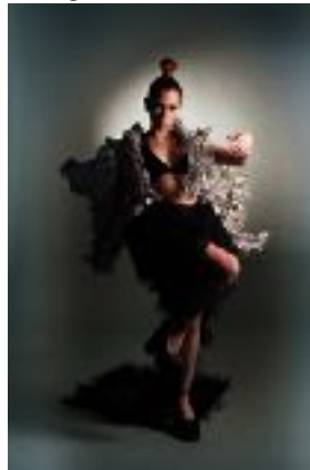
Imagen N°16. Mutante