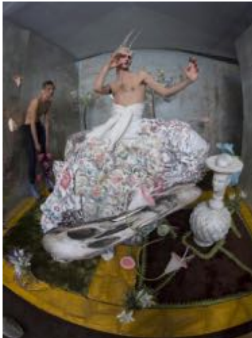
Imagen N°5. Box of Delights, Tim Walker