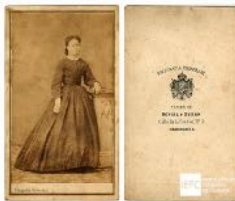
Imagen N°11. Tarjeta de visita, 1863-1867