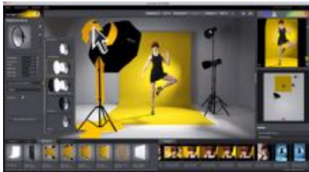
Imagen N°13. Set a light 3D