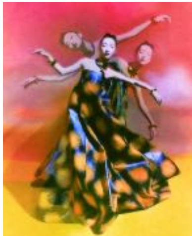
Imagen N°4. Elizaveta Porodina para Vogue China