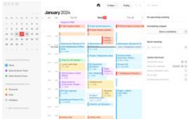
Imagen N°12. Notion