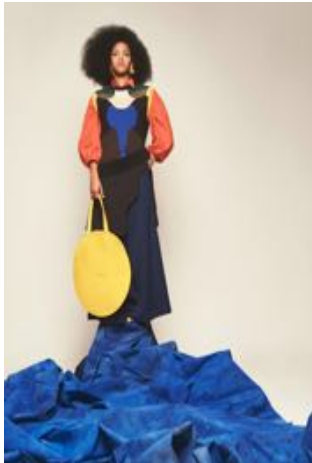
Imagen N°10. Soledad Rosales