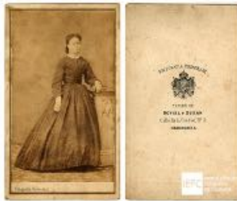
Imagen N°11. Tarjeta de visita, 1863-1867