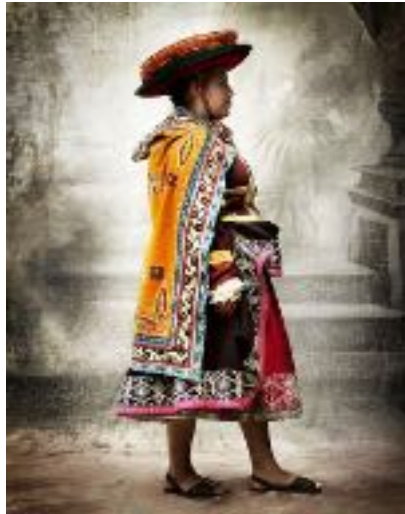
Imagen N°6. Alta moda, Mario Testino