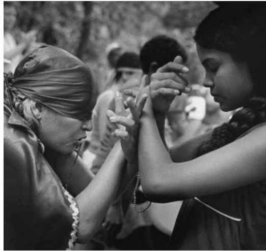
Figura n°2: La Diosa de los ojos de Agua