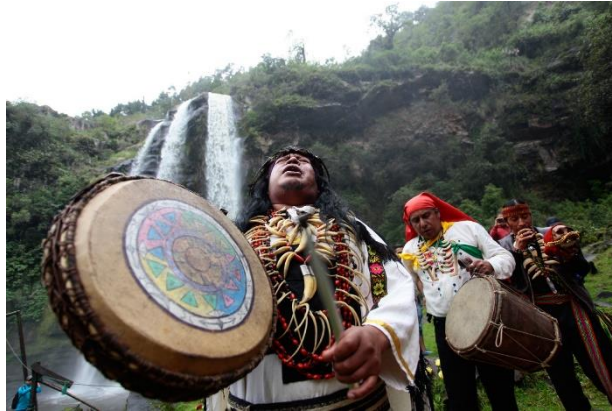
Figura N° 3: Rituales Shamánicos

(Río Pita.2018)