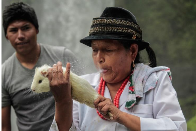
Figura N°2: Ritual Shamánico

(Río Pita.2018)