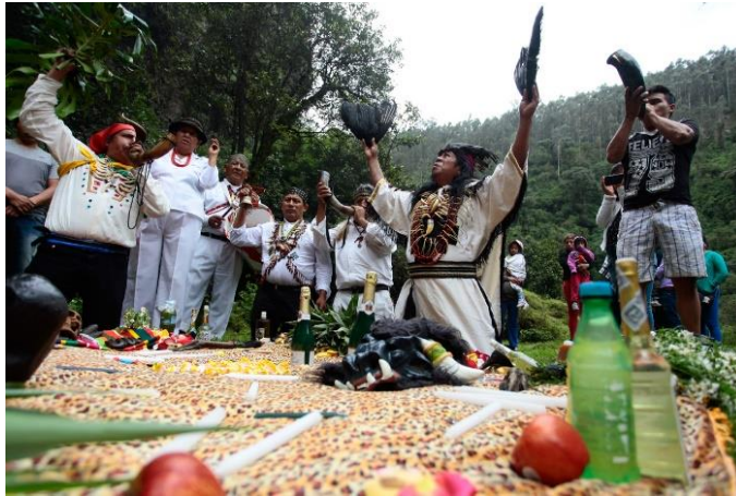
Figura N°1: Ritual Shamánico

(Río Pita.2018)